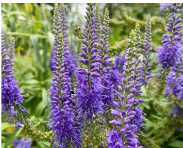
Langblättriger Blauweiderich ( Pseudolysimachion longifolium )