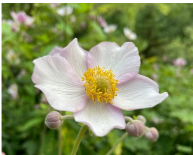
Herbst-Anemone ( Anemone hupehensis )